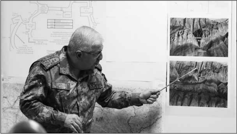
Genelkurmay Başkanı Orgeneral Yaşar Güler, Gara'daki mağara operasyonunu kroki üzerinde anlatıyor.

başka çıkışında duvar yüksekliği 50 santim kadardı. Demir kapılar dışarıya doğru açılıyor, kapının dışında asma kilide ek olarak sürgülü kilit de bulunuyordu. Demir kapı ile içerideki parmaklıklı kapı arası yaklaşık 30 santimdi. Orgeneral Yaşar Güler, kroki üzerinde elinde çubukla operasyonu şöyle anlatıyordu: